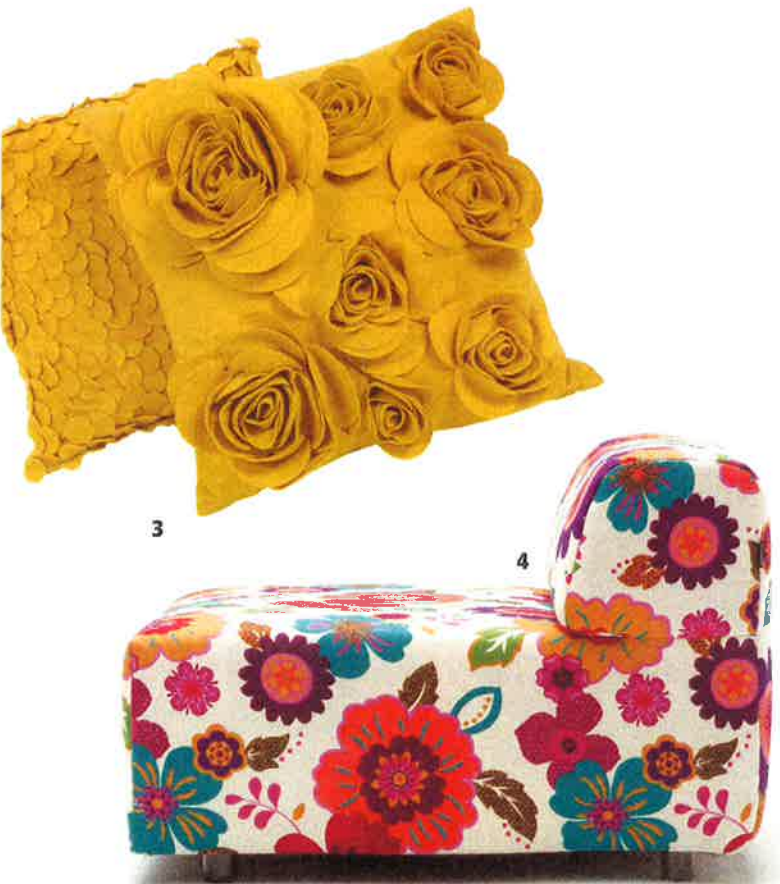
2 Der „Lounge Chair Hirche“ von Herbert Hirche entsteht 1953 während seiner Zeit als Professor an der Akademie der Künste in Stuttgart. Er geht seinerzeit aber nie über das Prototypenstadium hinaus. Erst ist im Jahre 2000 schafft er es zur Serienreife, mit unterschiedlichen Stoffen und in Kuhfell. Preis: Sessel plus Hocker ab 780 Euro. Richard Lampert | 3 Was für eine Pracht! Mit diesen Kissen mausert sich Ihr Sofa zur Sommerzone. Preis: ab 46 Euro. Kokon | 4 Der Frühling zieht ein: Mit dem Sessel „freistil 184“ fühlen Sie sich wie auf einer bunten Blumenwiese. Preis: wie abgebildet ab 666 Euro. Rolf Benz | 5 In diesem Jahr gibt es bei Ikea sichtbare Einflüsse aus Asien, Afrika und Südamerika – Handgemachtes und Ursprüngliches, wie zum Beispiel Schüsseln, Körbe und Kissenbezüge. Preis: ab 5 Euro. Ikea